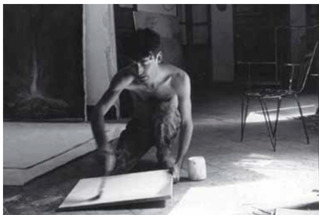
Torre de l'amor, Palma, 1987.