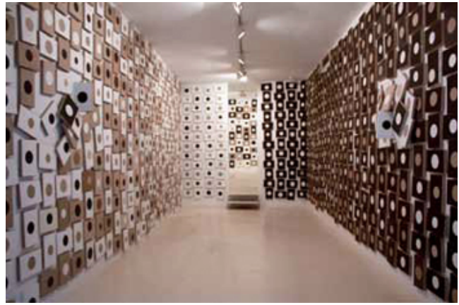
Campano «Elias (d'après Daniel Buren, 96/99)»