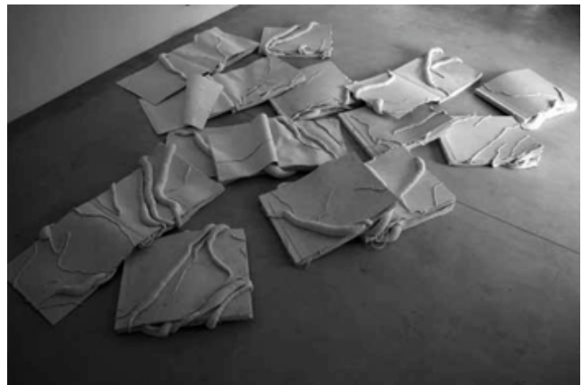
Caos, 2013 Papel, tela y acrílico Medidas variables