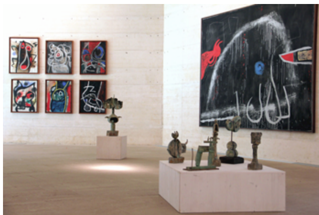
Vista de l'exposició Camps Creatius. Joan Miró

La diversidad de campos creativos marcó la última etapa de producción de Miró, de la que se nutre gran parte del fondo artístico que conserva la Fundació Pilar i Joan Miró. Es cuando el artista transmite su deseo de "ir más allá", como solía decir, infringiendo todas las normas tradicionales de la expresión artística. El choque, la ruptura, la apertura fueron una elección constante hasta sus últimos días; y sus obras, por tanto, tuvieron una mayor independencia, libertad de expresión y radicalismo. Esta exposición representa una nueva lectura de la colección permanente.