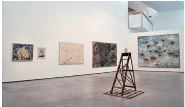
Vista de l'exposició Implosió

Un big bang interno reinventa el museo en su décimo aniversario. Implosió propone nuevas lecturas y cuestionamientos basados en las colecciones de Es Baluard e incidiendo en determinados puntos calientes cuyas ondas expansivas permitieron avances en las prácticas artísticas contemporáneas. La muestra es una plataforma para instruir las miradas en la decodificación de lo que existe más allá de lo aparentemente real. Pero también, la articulación de la producción artística desde finales del XIX hasta nuestros días en el contexto de Baleares y con la presencia internacional.