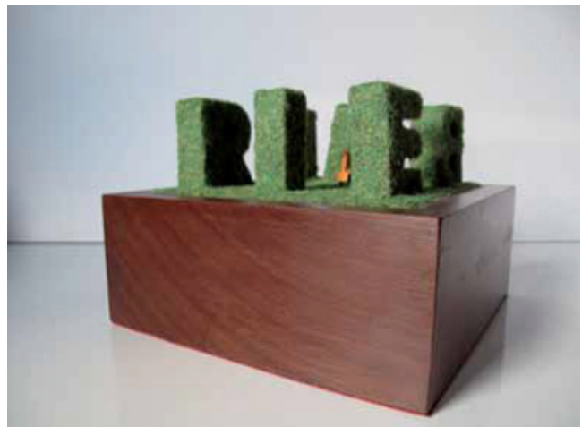
Hierba, 2013 T. mixta 40 x 35 x 30 cm

De nuevo de la mano de un haiku, la artista inicia una nueva serie de ilustraciones. En esta ocasión, uno de Kikusha-ni que le sugiere, con tan pocas palabras y con gran lucidez, ese momento de intimidad con uno mismo. Ese momento en que un individuo se encuentra a solas frente a la Luna, como un instante inmenso, donde pueden aflorar los sentimientos más recónditos. Sentimientos vivos, a flor de piel, son también los versos que ha tomado prestados de varios poetas para ilustrar esta nueva serie agrupada bajo el nombre de Versiones.