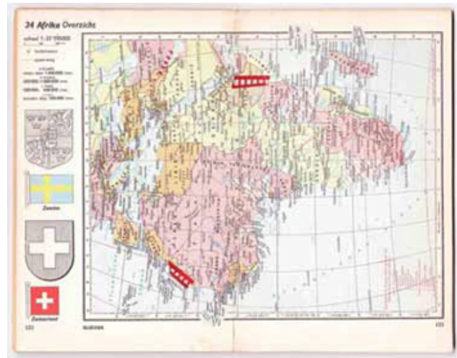
Map of África Steps leading to the current situation, 2014 Cortesía de Yara El-Sherbini y La Caja Blanca