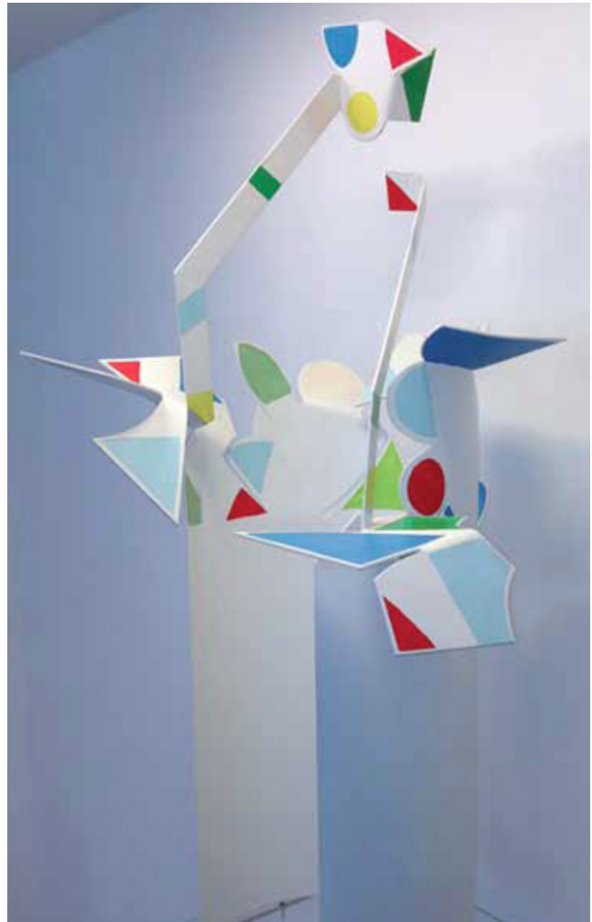
Florero El beso Acero inox. pintado 54 x 52 x 108 cm

Es una de las figuras más destacadas de la generación abstracta española de la década de los 50. Sin pertenecer a ningún grupo ni adscribirse a ningún estilo, Mompó comenzó investigando en el ámbito de la figuración para evolucionar hacia la abstracción y acabar encontrando un lenguaje propio. Su obra prima la influencia de la luz, propia de pintores levantinos. Una luz mediterránea que queda plasmada en sus telas a través del predominio del blanco y los tonos luminosos. Pequeños grafismos en brillantes colores salpican sus pinturas llenas de sutiles resonancias figurativas.