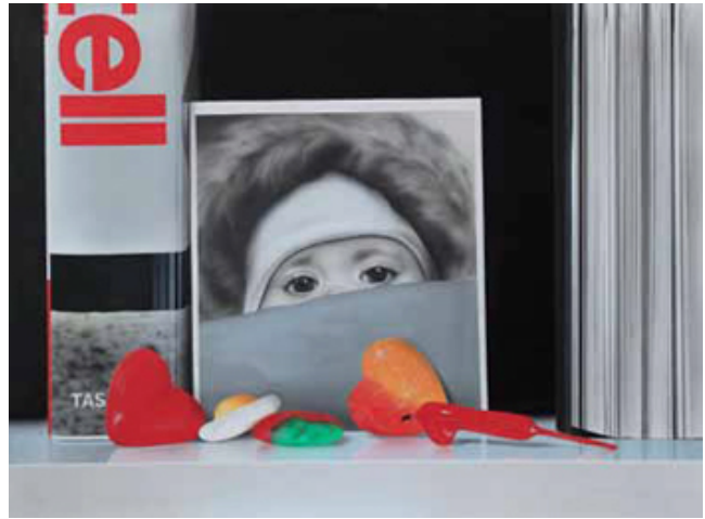
Uno Acrílico y óleo sobre tabla 4 3,5 x 70 cm

Todos los objetos que nos rodean tienen una historia. Existen porque los hemos creado y, de algún modo, existimos gracias a ellos. Miguel Piñeiro explora esa conexión en su obra, creando un retrato de su propio entorno en un marco de originalidad e ironía. El resultado es el reflejo de la individualidad, de la cultura y, en muchos casos, de la dependencia compartida. Todo ello a través del hiperrealismo y de materiales tan diversos como la madera, el metacrilato o las resinas, que tratan de crear naturalezas muertas que cobran tridimensionalidad.