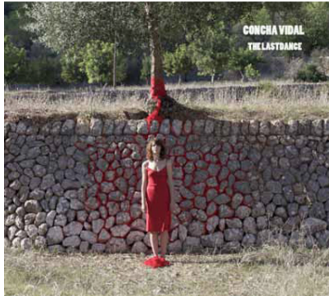
Mur de sang (Detalle) Fotografía sobre Dibond 70 x 105 cm 2013

* A partir de un texto de María Antonia de Castro